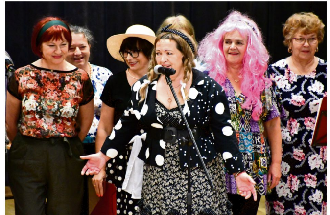
Kabaretowe show w Dniu Kobiet przedstawili Porębianie.