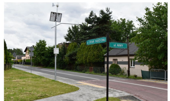
Przebudowa drogi powiatowej nr 1877K ul. Niwy, ul. Sportowa oraz ul. Ofiar Faszyzmu w Brzezince kosztowała ponad 4,1 mln zł.

innych gmin to m.in. rozbudowa i remont ul. Wysokie Brzegi i Szpitalnej oraz modernizacja ul. Nideckiego, a także odcinków ul. Tysiąclecia i Olściskiego w Oświęcimiu. Dobiega końca rozbudowa ul. Centralnej w Łowiczkach. Kolejne zmodernizowane odcinki dróg powiatowych są zlokalizowane m.in. w Kętach (ul. Św. Jana Kantego), Bobrku (ul. Nadwiślańska) i w Jawiszowicach (ul. Pocztowa).